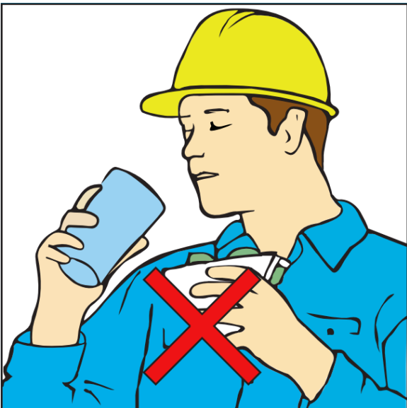
Niet eten of drinken tijdens het werken met lood