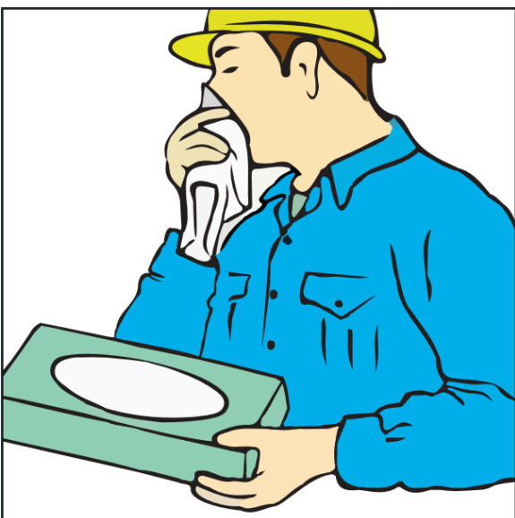
Gebruik alleen papieren zakdoekjes om de neus te snuiten.