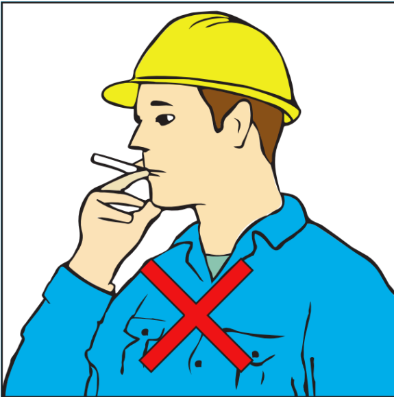
Niet roken tijdens het werken met lood