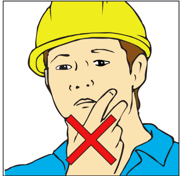
Niet aan het gezicht zitten tijdens het werken met lood