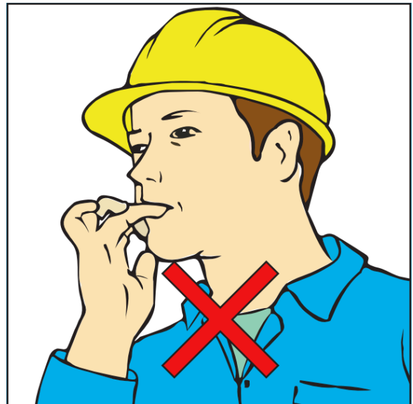
Niet nagelbijten tijdens het werken met lood