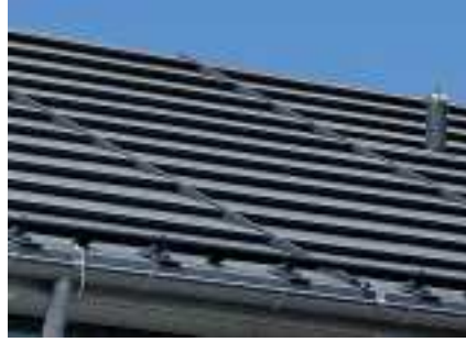
Het QUICK STEP-RHEINZINK® systeemdak in RHEINZINK®-"Graphite Grey pro"