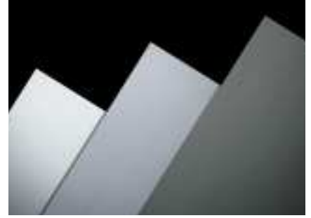
De verschillende RHEINZINK®-varianten walsblank, "Nature Grey pro" en "Graphite Grey pro"