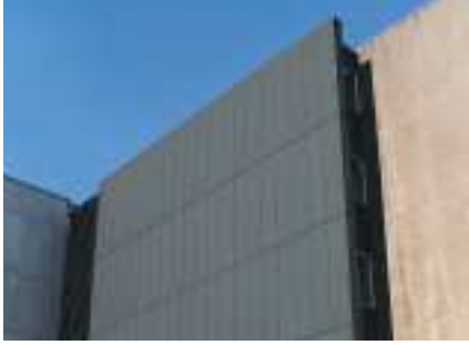
Het RHEINZINK®-plankprofiel in RHEINZINK®-"Graphite Grey pro"